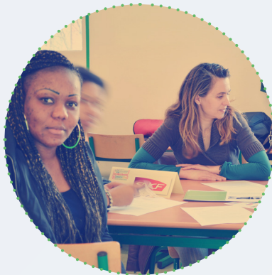
Forum des métiers

Établissement Public Local d'Enseignement (Collège ou lycée)