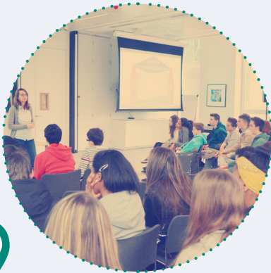
Stages découverte en entreprise (Classe de 3e)