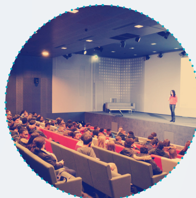
Toute initiative en faveur du rapprochement École/Entreprise